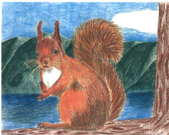
Sandra Ley, Caux, avril 2020

Oh combien avons-nous pu admirer les chants des oiseaux pendant ces dernières semaines où les bruits de notre monde agité se sont largement estompés !